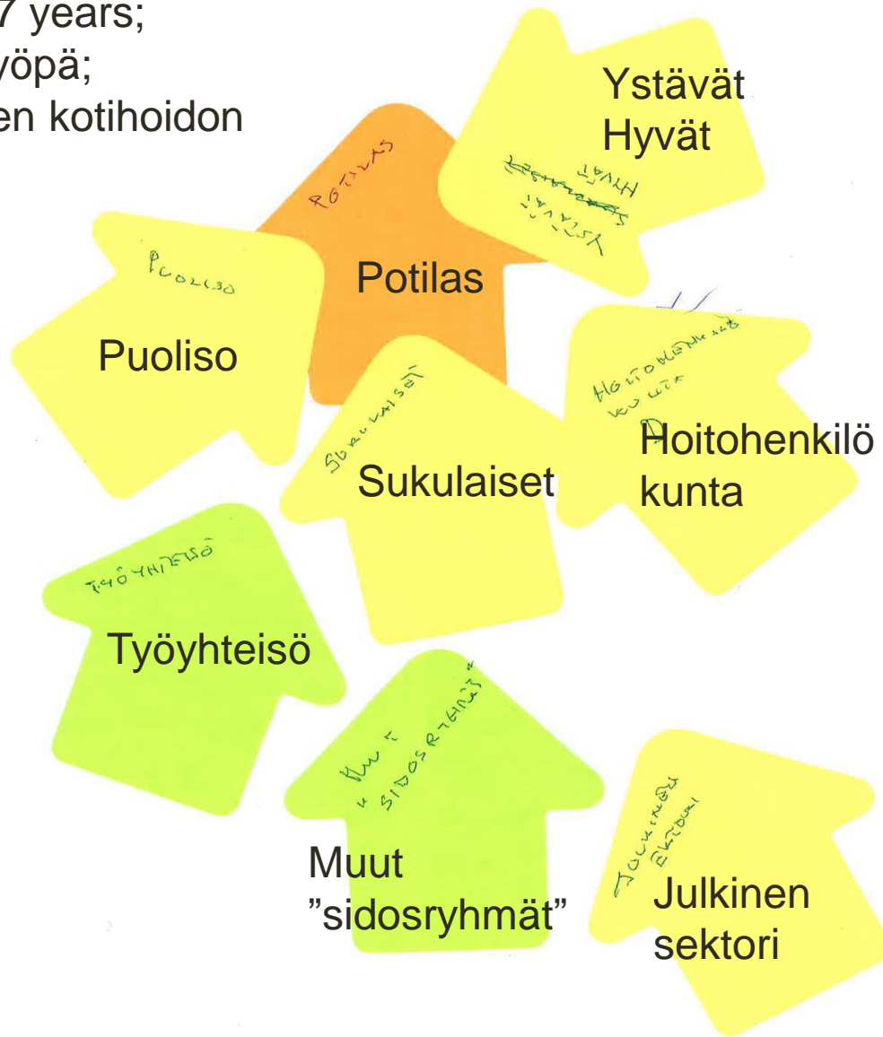
Example of Pictor Chart

Tapio, 67 years; Haimasyöpä; Yksityisen kotihoidon potilas